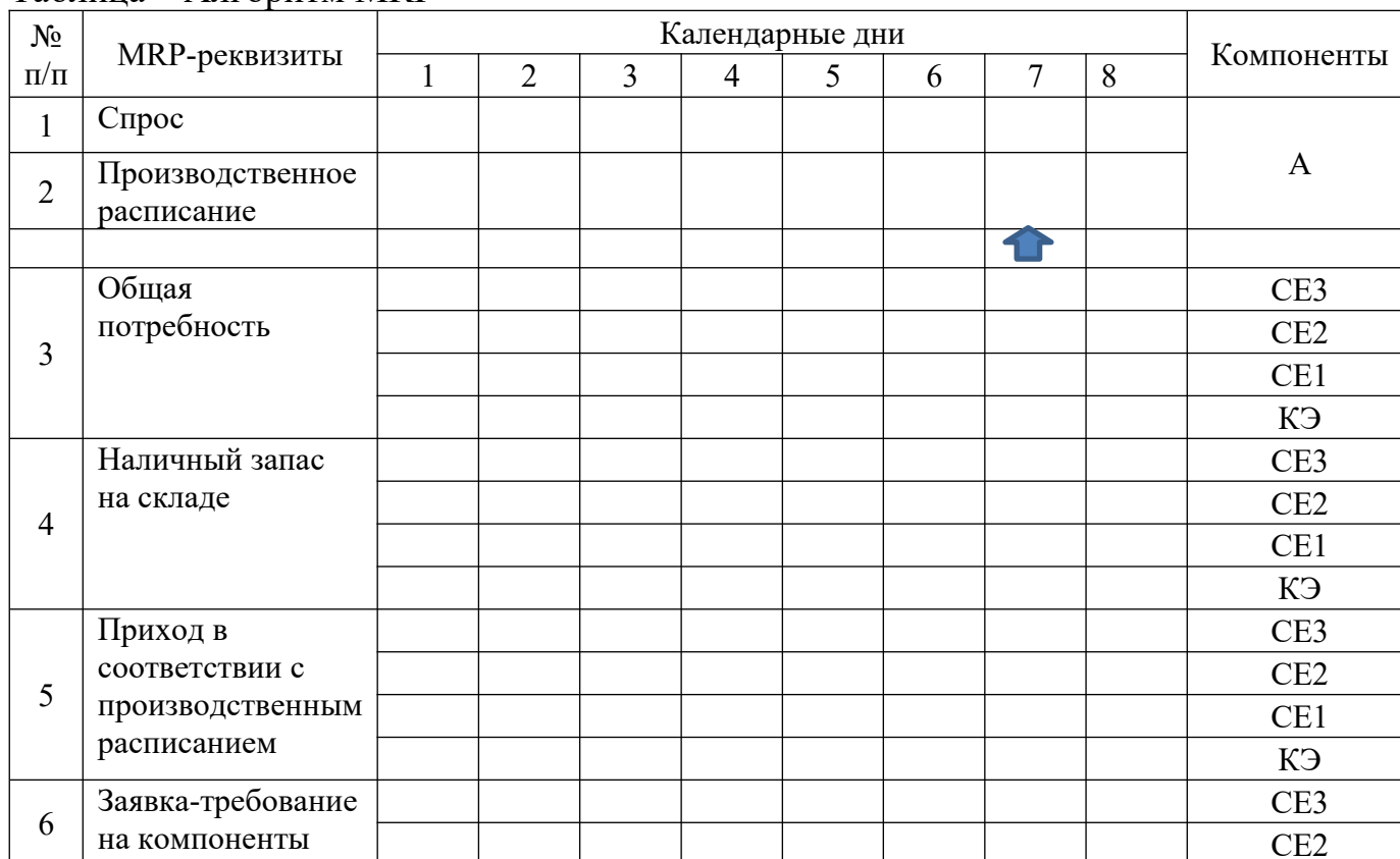
Таблица – Алгоритм MRP